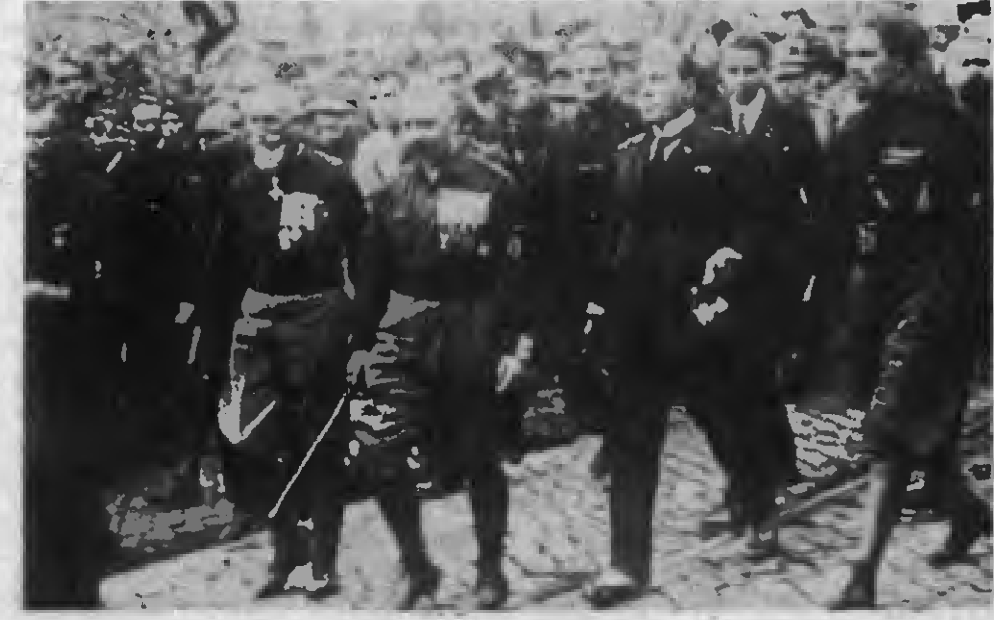
Mussolini'nin sözde "Büyük yürüyüşü"nü düzenleyen İtalyan ordusunun generalleriyle Roma'da... "Büyük Yürüyüş" burjuvazinin göz boyamasıydı.

Devrimci bir program temelinde sosyalizm, savaşın sonra çok güçlü bir yığın desteği kazandı. 1910'a dek zayıf olan ve reformist, işbirlikçi politikaların egemen olduğu İtalya Sosyalist Partisi (İSP), 1911'de Trablus-garp savaşına karşı yürüttüğü savaşla sola doğru gitmeye başladı. 1912'de Reggio Emilia Kongresi'nde Bonomi ve Bissoleti önderliğindeki şovenist reformistleri saflarından atarak partiyi güçlendirdi. Böylece 1906 ile 1910 yılları arasında 36.000'den 24.000'e azalan üyeliği, 1912'de 27.000'den 1914'de 48.000'e yükseldi. Güçlenen parti, savaş sırasında Zimmerwald çizgisini izleyerek savaşın 70.000 üye artışı, yüksek bir saygınlık ve yığınsal destekle çıktı.