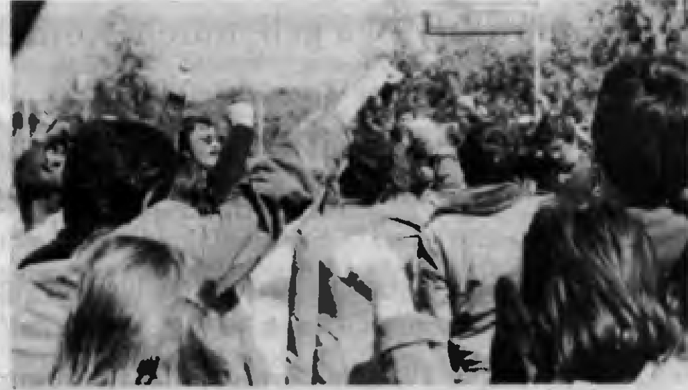
(İzmir muhabirimiz bildiriyor)

Böylesi bir politikayı TKP savunuyor, bu uğurda savaşıyor. Bu da Ulusal Demokratik Cephe kurma yoluyla olabilir. İşçi sınıfı, emekçiler 1 Mayıs alanına bu parolayla, bu belgilerle çıkacaktır. İşte kılavuz, işte görünen köy.