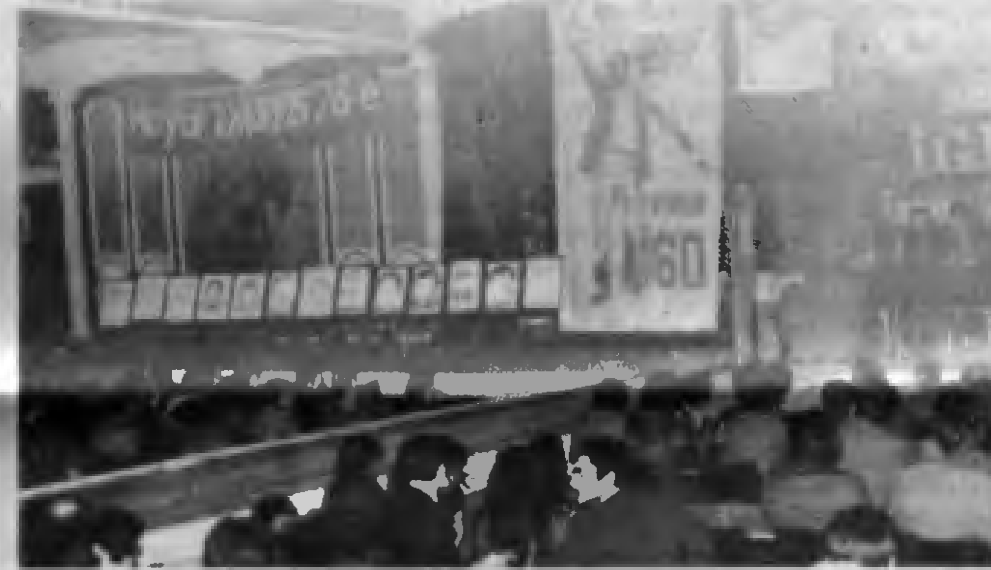
İGD Eminönü Şubesi Kongresinden bir görüntü

serbest bırakılması ve genel kurulda, tutuklu arkadaşlara dayanışma mesajı gönderilmesi.