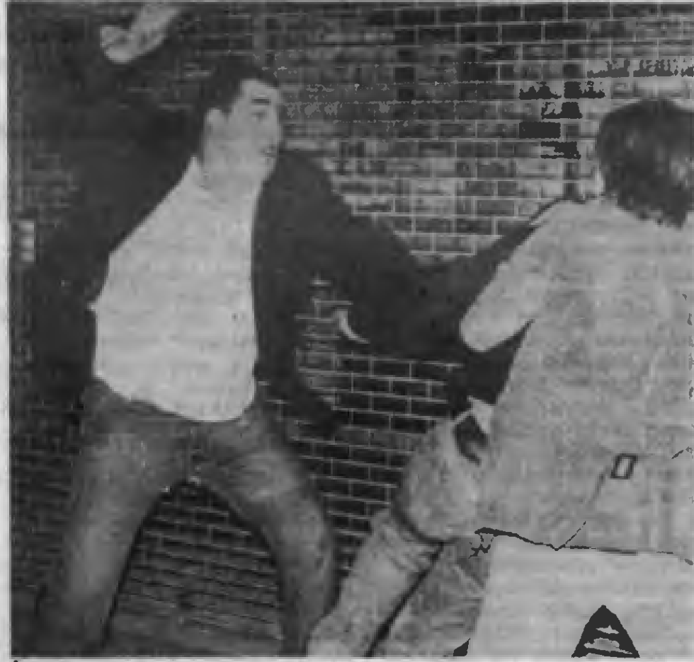
İngillere'de faşist saldırılar yoğunlaştı.

Emperyalist propaganda emperyalist ülkelerdeki ekonomik ve sosyal krizlerin nedenlerini Afrika, Asya ve Latin Amerika'nın savaşan halklarına yüklemek