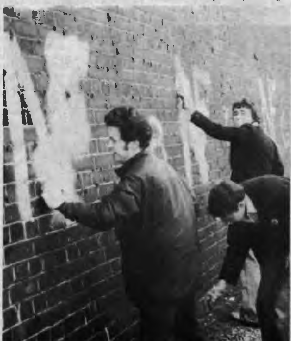
Anti-faşist güçler, faşist sloganları temizlerken.

Bakalım Carillo'nun parti statüsündeki "Marksçı-Leninci" olma koşulunu son zamanlarda uydurulan "Marksçı, demokratik ve devrimci(!)" olma şekline değiştirme yutturmacaları daha ne kadar sürecek?