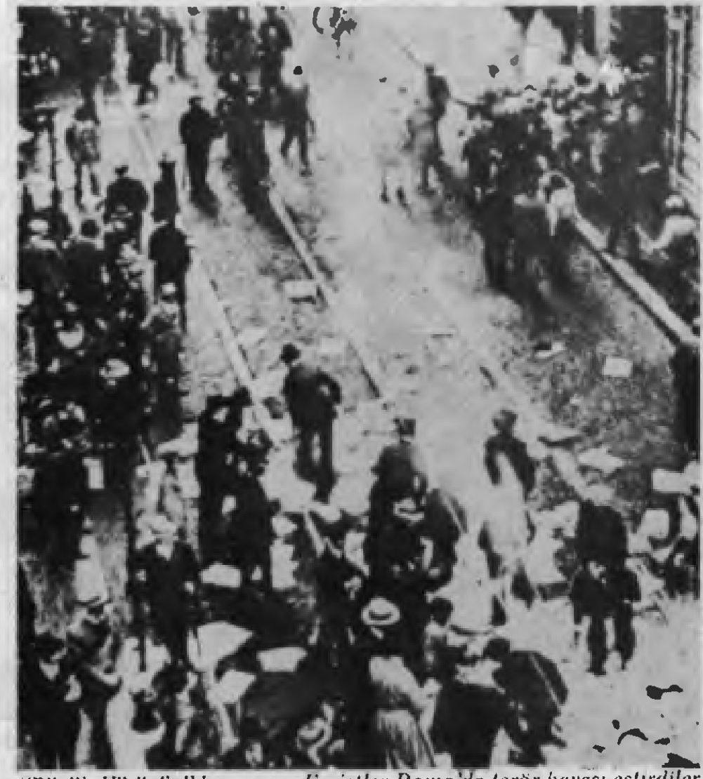
"Büyük Yürüyüş"den sonra Faşistler Roma'da terör havası estirdiler

("İtalya Sorunu Üzerine. Komünist Enternasyonal'in Üçüncü Kongresi". 22 Haziran — 12 Temmuz 1921. Toplu Yapıtlar. İngilizce basım, c:32, s:462-467.