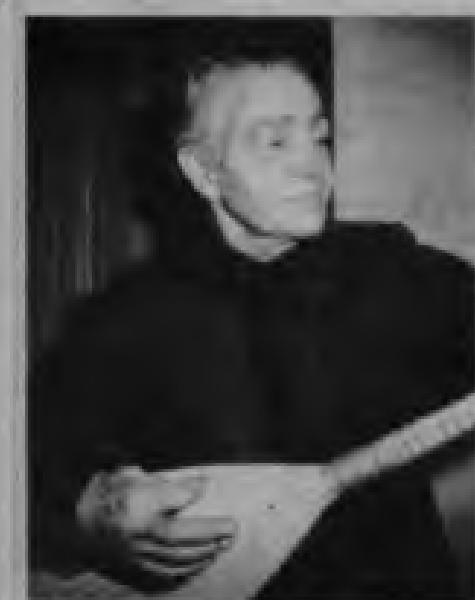
Büyük devrimci ozan Ruhl Su

Yurdumuzdaki 1 Mayıs'ın coşkulu havasını binlerce kilometre ötede daha iyi canlandırabilmek için İTİB büyük bir gece düzenledi. 1 Mayıs'ı kutlama gecesi 28 Nisan cuma akşamı yapılacaktır.