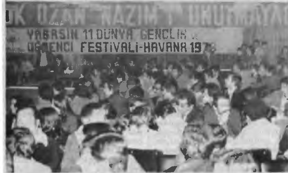
Kongreye katılanlardan bir grup