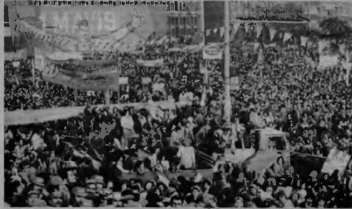
1 Mayıs 1977'den daha vığınsal, daha görkemli 1 Mayıs için ileri