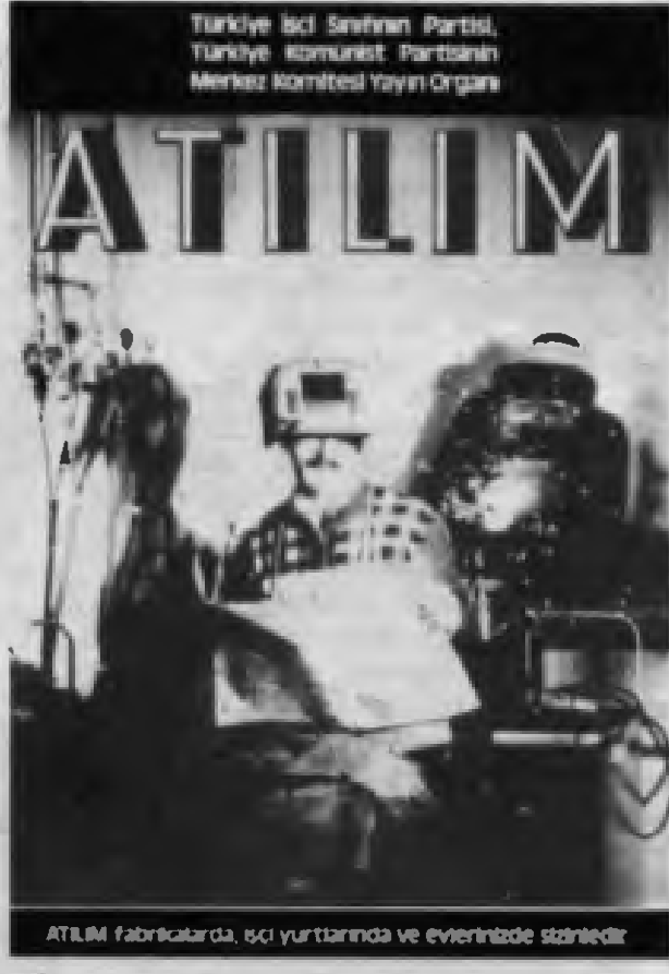
ATILIM fabrikalarda, işçi yurtlarında ve evlerimizde okunmalıdır

Atılım'a bağış kampanyası bütün hızıyla devam ediyor. Yurtta ve yurt dışındaki işçilerimiz Atılım'ı güçlendirmek için, onu daha yaygınlaştırmak için bağışlar topluyorlar, toplananlar düzenliyorlar. Her işyerine Atılım'ı sokuyorlar, okuyorlar, tartışıyorlar. Herşey Atılım için!